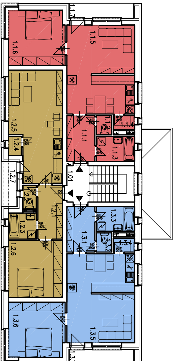
Pôdorys 1. nadzemného podlažia